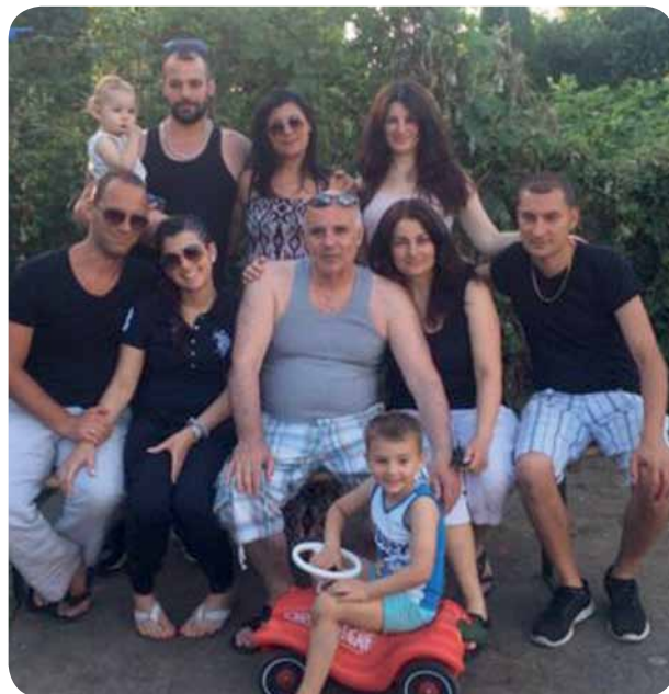
Familie Sciacca verwöhnt uns mit leckeren Speisen und Getränken.

Selbstverständlich sind unsere Wirtsleute flexibel, um bei größeren Gruppen Ausnahmen zu machen. Das Restaurant ist wie gewohnt telefonisch unter 06173/65140 erreichbar. Für den Restaurantbetrieb gelten die aktuellen Regeln für die Gastronomie in Hessen. Unsere Wirtsleute freuen sich auf Euren Besuch.