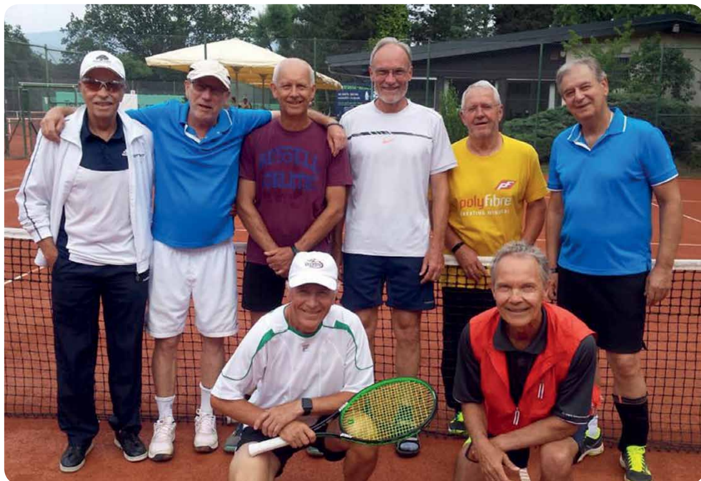
Wurden Meister der Regionalliga Süd-West – die two-Herren 65

Dort trifft man dann auf die Regionalliga-Meister aus Nord-Ost, West und Süd-Ost.