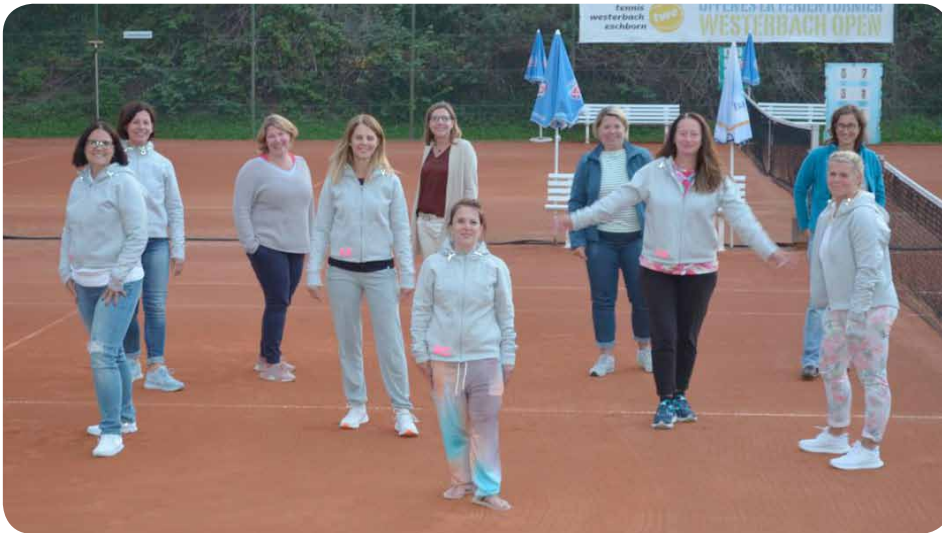
Aufsteiger Damen 40 III