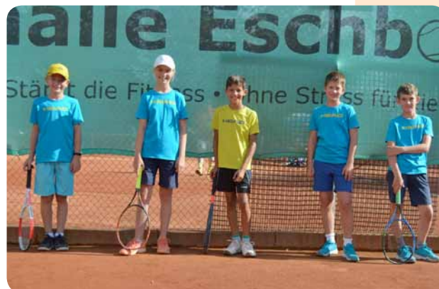
Die Meister der gemischten U12

Mit insgesamt drei Aufstiegen war die Saison am Ende doch sehr erfolgreich und alle Spielerinnen und Spieler hoffen, im nächsten Jahr wieder auf »regulären« Spielbetrieb, bei dem dann auch Umkleiden, Duschen und die Verpflegungen wieder vollumfänglich genutzt werden können.