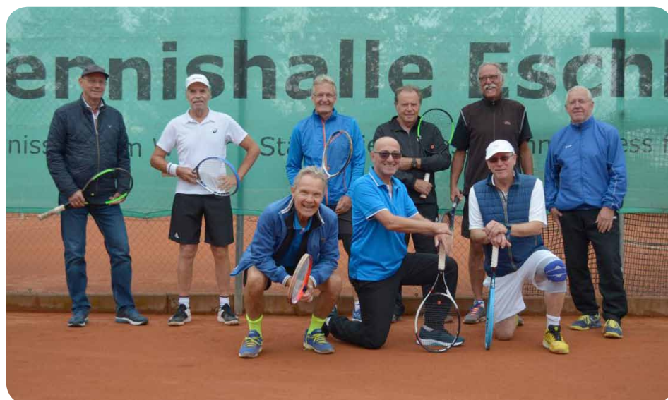
Aufsteiger Herren 60